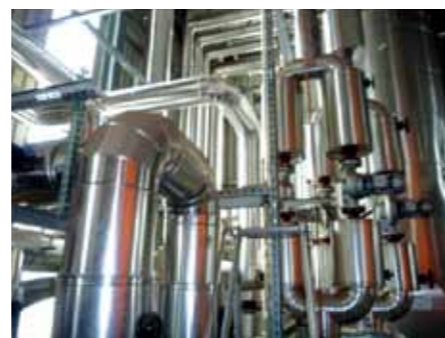
Tuyauterie hydraulique dans la centrale de chauffe. Départ pour le Chauffage à distance.