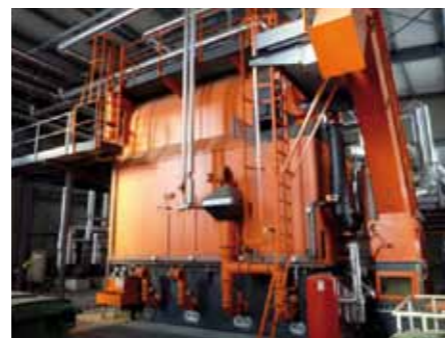
Chaudière Mawera de 3.0 MW du Thermoréseau d'Avenches.

Thermoréseau Avenches SA c/o Fiduciaire François Chuard SA Rue Centrale 47, 1580 Avenches 026 675 35 39, Info@immochuard.ch